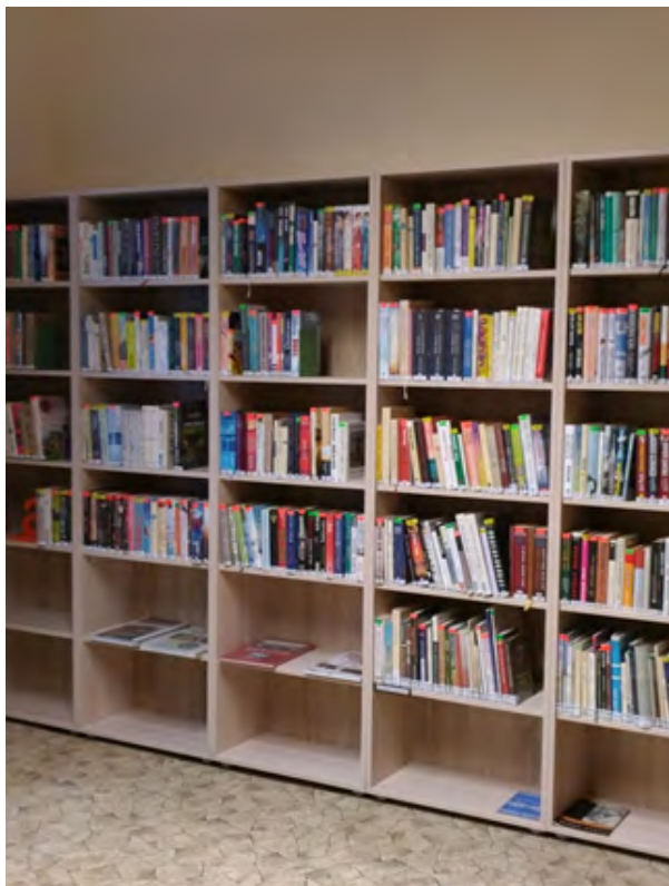
Příloha č. 1: foto — místní knihovna Libivá